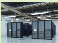
サーバーームのメンテナンスに