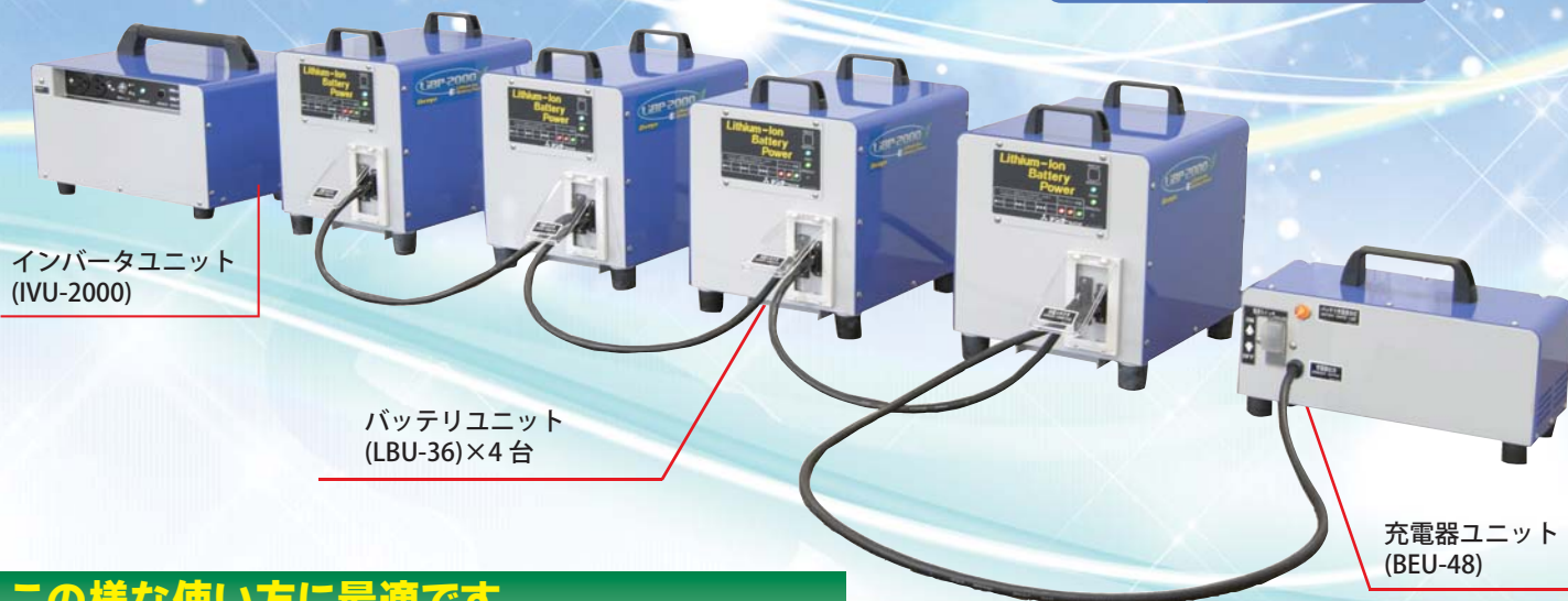
インバータユニット (IVU-2000)