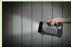
停電時のバックアップ電源に