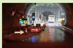
トンネル工事や屋内工事など