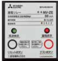
漏電保護装置パネル

三相・单相ともに漏電遮断装置が作動します。单相100V出力と三相出力の漏電を区別して検出し、それぞれ遮断器がトリップする選択遮断方式を採用。電源の信頼性を向上させています。