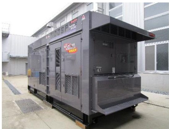
水素混焼ディーゼル発電機外観